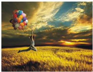
总是在欢呼雀跃中度过最美的青春